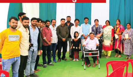
धार्मिक व सांस्कृतिक उत्सव आयोजित किए जाएंगे, जबकि 15 फरवरी को शिव

को सुव्यवस्थित, सुरक्षित एवं आकर्षक बनाना रहा। बैठक में सर्वसम्मति से शिव बारात को ऐतिहासिक बनाने हेतु कई अहम प्रस्तावों पर निर्णय लिया गया। इनमें बारात पर सुदृढ़ प्रकाश व्यवस्था करने, महिलाओं के समूह में महिला वालंटियर नियुक्त करने, आयोजन के दौरान 20 वॉकी-टॉकी की व्यवस्था करने का प्रस्ताव शामिल रहा। इसके साथ ही मंदिर परिसर एवं आसपास प्रतिदिन साफ-सफाई, सात दिन चलने वाले उत्सव में प्रतिदिन अलग-अलग श्रृंगार किए जाएंगे।