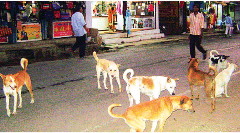
हरिभूमि न्यूज़ ॥ मुलताई

नगर में आवारा कुत्तों का आतंक लगातार बढ़ता जा रहा है और हालात अब चिंताजनक स्तर पर पहुंच चुके हैं। शनिवार सुबह से देर शाम तक नगर के विभिन्न इलाकों में आवारा कुत्तों के हमलों से दहशत का माहौल बना रहा। एक ही दिन में 20 से अधिक लोग कुत्तों के काटने से घायल होकर शासकीय अस्पताल पहुंचे, जिससे स्वास्थ्य विभाग पर भी दबाव बढ़ गया है। जानकारी के अनुसार बीते करीब पंद्रह दिनों में कुत्तों के काटने से घायल होने वाले लोगों की