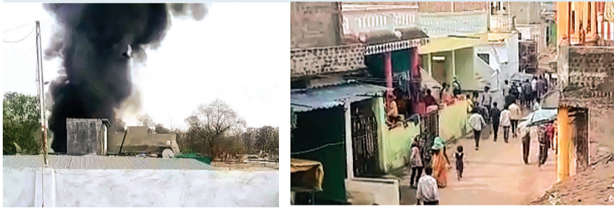
हरिभूमि न्यूज़ ॥ बैतूल

आक्रोशित लोगों ने दुकानें जलाई, तोड़फोड़ की, पुलिस ने आरोपी को पकड़ा