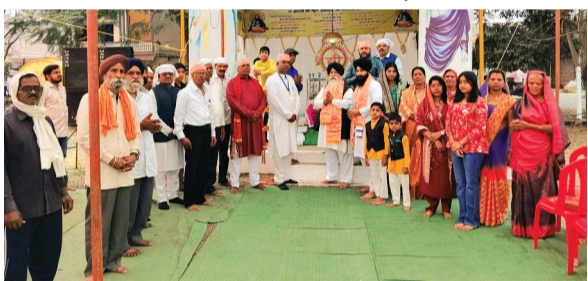
हरिभूमि न्यूज़ ॥ बैतूल