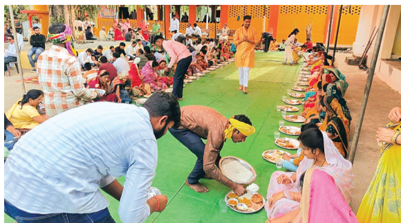
हरिभूमि न्यूज़ ॥ भोरा

क्षेत्र में रविवार का दिन पूरी तरह धार्मिक आस्था और सेवा भाव को समर्पित रहा। विभिन्न स्थानों पर आयोजित रामायण पाठ और भंडारे के कार्यक्रमों में श्रद्धालुओं एवं ग्रामीणों की उल्लेखनीय सहभागिता देखने को मिली, जिससे पूरे क्षेत्र में भक्तिमय माहौल बना रहा। शाहपुर आमढाना के प्रसिद्ध धार्मिक स्थल लमटी हनुमान मंदिर में भौरा